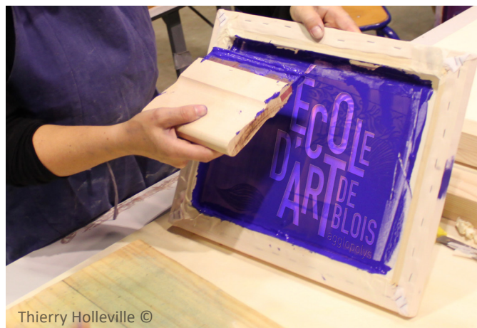
Thierry Holleville ©