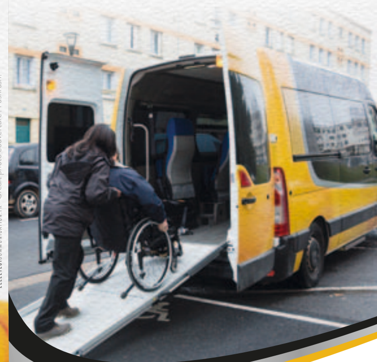
ELLEETLUDOMUNICATION.FR - Crédit photo couverture : Pashrash.