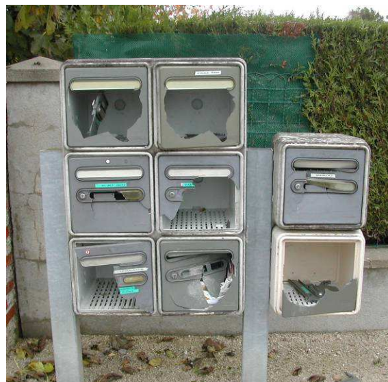
Un bien triste spectacle !