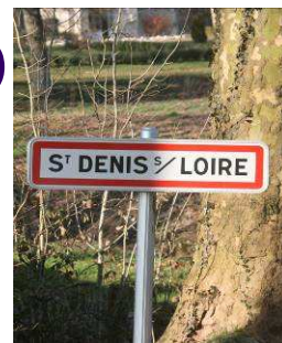
Bulletin n° 59